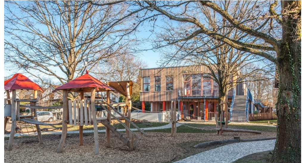
Für Kinder über 3 Jahren: Spiel-, Rutsch und Kletterhäuschen mit Seilbrücken und Balancierstämmen