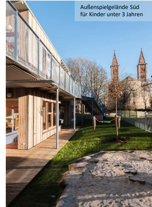
Außenspielgelände Süd für Kinder unter 3 Jahren