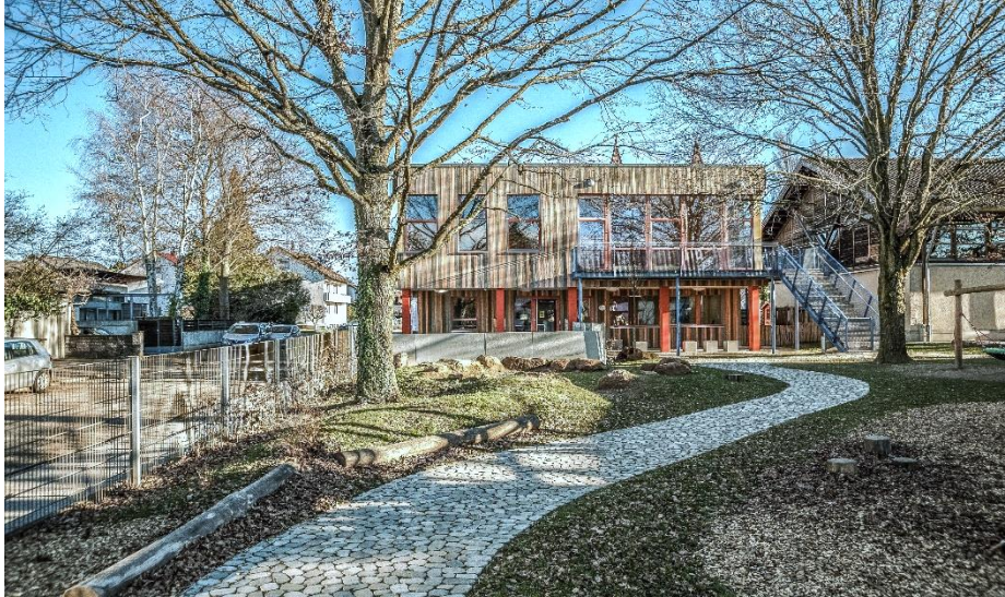
Für Kinder über 3 Jahren: Multifunktionales Spielgelände mit Fahrwegen und Natursteinkreis